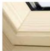
Holz klar lackiert