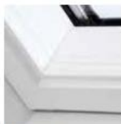
Holz weiß lackiert