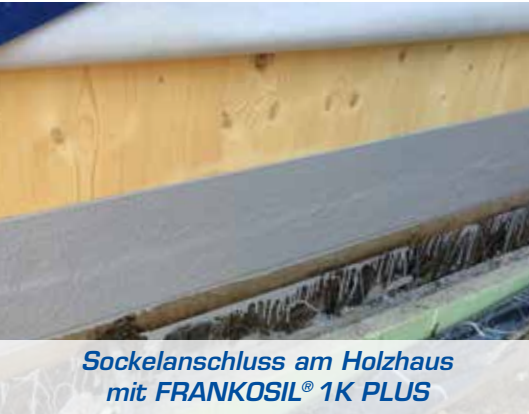
Sockelanschluss am Holzhaus mit FRANKOSIL® 1K PLUS