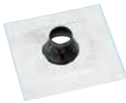
Divoroll Solar-Dichtmanschette 42-55 mm / 50-70 mm